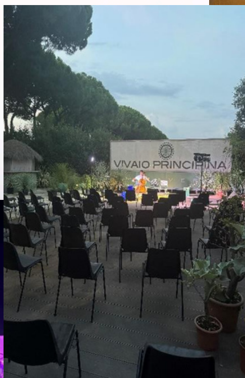
Concerti presso Hotel Terme Loepoldo II Marina di Grosseto