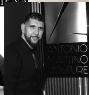
ANTONIO MARTINO COUTURE