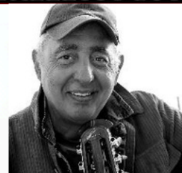
Conservatorio di Siena Rinaldo Franci